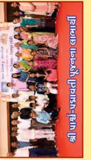
શ્રી પાશ્ચ-પદ્માવતી પૂજના લાભાર્થી