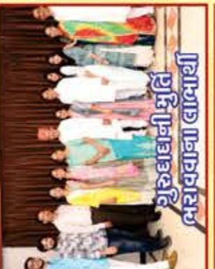
યુરુદાદાની મુર્તિ ભરાવવાના લાભાર્થી