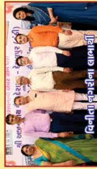
વિનીતા નગરીના લાભાર્થી