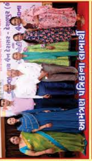
આમંત્રણ પરિકાના લાભાર્થી