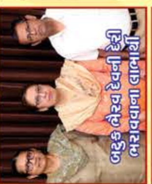
બદુકલૈરવ દેવની દેરી ભરાવવાના લાભાર્થી