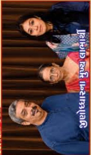
જીવોધારના મુખ્ય લાભાર્થી