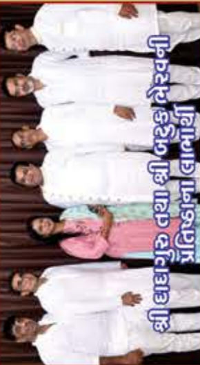
શ્રી ઘાઘગુરુ તથા શ્રી બદુકલૈરવની પ્રતિષ્ઠાના લાભાર્થી