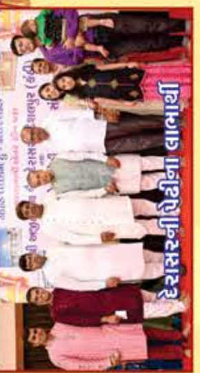
દેરાસરની શેઠીના લાભાર્થી