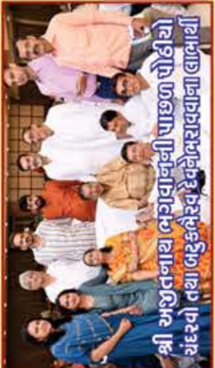
શ્રી અખિતનાથ ભગવાનની પાછળ પોઠીયો ધરવો તથા બદુકલૈરવ દેવને ભરાવવાના લાભાર્થી

અમેરિકાના ડિઝનીવેલ્ડ જેવા અમારા મધરલેન્ડ એવરગ્રીન